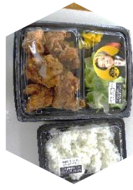
おかんのから揚げ