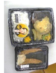
ハンバーグ&エビフライ