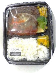
ツインハンバーグ