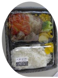
ハンバーグ&サイコロステーキ

いつも利用するお店のテイクアウト（お持ち帰り弁当）を利用して、食事は下の中から好きなものを選びました。