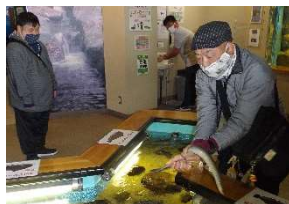
ウナギを捕まえました