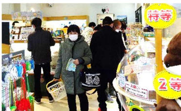
買い物もしっかりしました