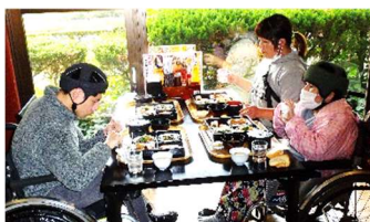
昼食もおいしかったです