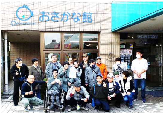
おさかな館前で記念撮影

場所は松野町の「おさかな館」を中心に、広見町の道の駅、「三角帽子」や三間町の道の駅等により、それぞれが思いも思いに秋の1日を楽しみました。