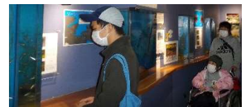
しっかりと見学しました