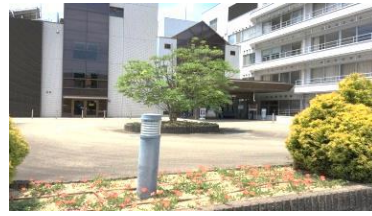
たくさんの花を植えました