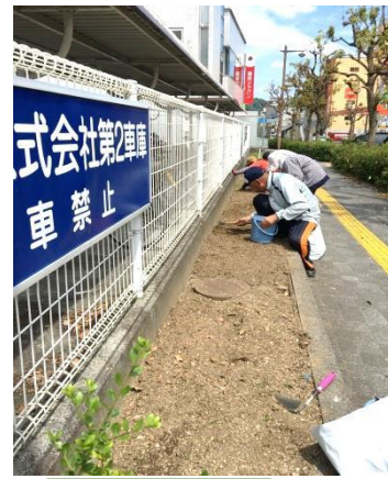
花植え前の除草作業