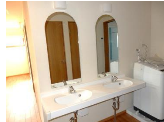
せんめんじょ 洗面所